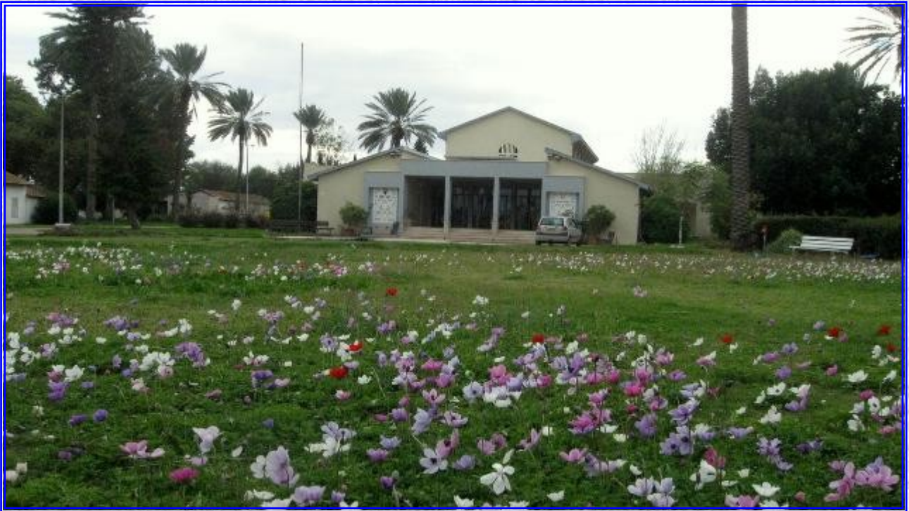
פרחי חורף בשדה-אליהו