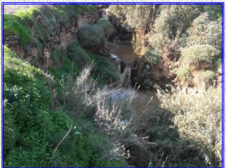
קניון הבזלת